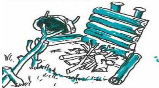
"Lænestol" som reflektor og varmekilde.