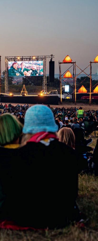
Pernille Bille Tvedt / Spejderne