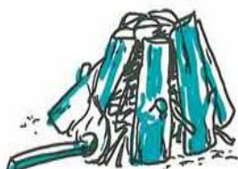
Bålet kan også bygges helt færdigt og tændes i bunden.