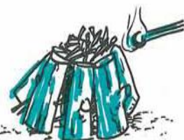
Det kan også tændes i toppen, så udvikles der mindre røg. Bålet brænder roligere og kan fra starten være klar til flere timers brænding.