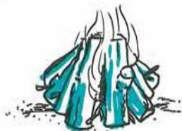
Når der er ild, lægges tykke stykker på.